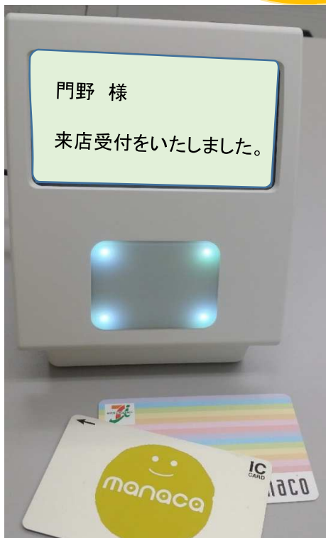
【上】 ICカードを使用したモデル